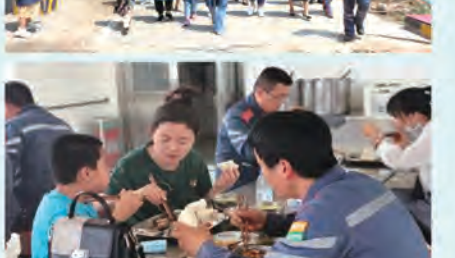
化工公司综合管理部办公室